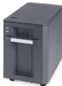
MAGASIN PAPIER DE 3000 FEUILLES PF-770 Idéal pour les gros travaux d'impression au format A4.