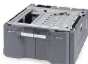
MAGASIN PAPIER DE 3000 FEUILLES (2 x 1 500) PF-740 Supporte les formats A4, B5 et lettres.