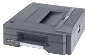
MAGASIN LATÉRAL MULTI SUPPORTS DE 500 FEUILLES PF-780 Magasin papier pour des types de support spéciaux. À associer aux options PF-730 et PF-740.