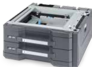
MAGASIN PAPIER DE 1000 FEUILLES (2 x 500) PF-730 Idéal pour des formats de papier compris de A5 à A3+ (305 x 457 mm).